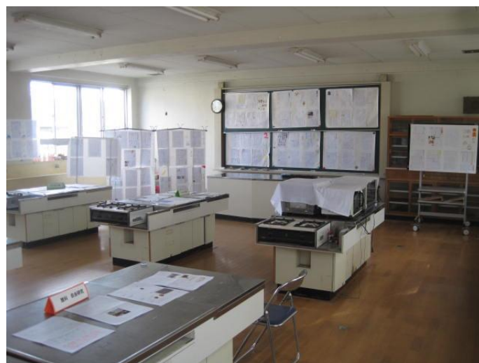
調理室展示（クッキング部と2年生展示）