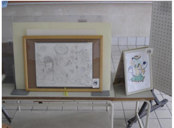
クラブ黒板前展示（アート部）