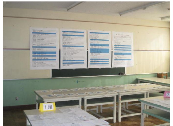
第2美術室展示 (1年生)