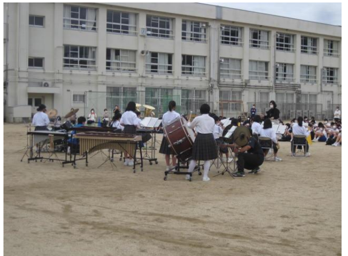
9月30日吹奏楽部ラストコンサート